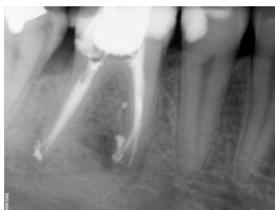
Figure 1 : l'irrigation a permis le nettoyage et l'ouverture du canal latéral sur la racine mésiale de cette 46, autorisant le passage du ciment de scellement sous la pression du compactage

[...] Dans une étude de 2001, Peters et coll. indiquent que la proportion des parois radiculaires non instrumentées lors de la préparation canalaire est au minimum de 35%. Seuls les agents d'irrigation permettent d'atteindre, en partie, les régions complexes de l'endodonte comme les canaux accessoires, canaux latéraux, delta apicaux et autres particularités anatomiques qui restent inaccessibles aux instruments (figure 1). Parallèlement, la mise en forme canalaire, quelle que soit la technique utilisée, produit un très grand nombre de débris organiques et inorganiques [...].